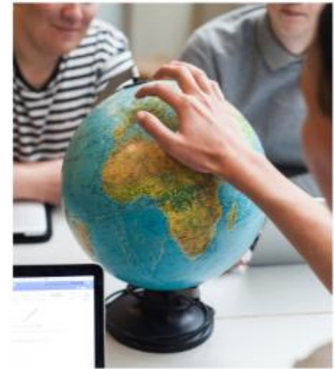
samfundsfaglig + Global studies